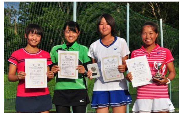
16歳以下女子シングルス