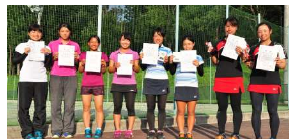
18歳以下女子ダブルス