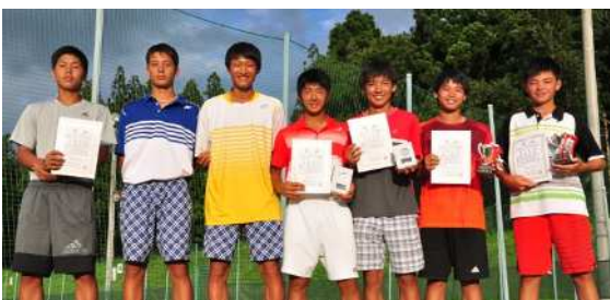
16歳以下男子ダブルス