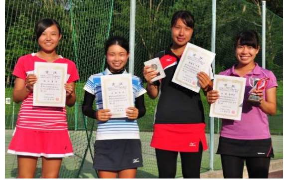
18歳以下女子シングルス