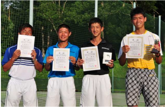
18歳以下男子シングルス