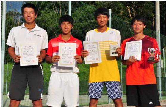
16歳以下男子シングルス