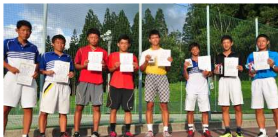
18歳以下男子ダブルス